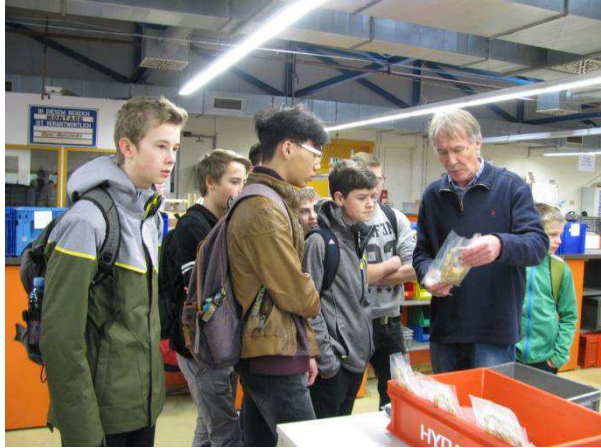
Verpackung und Marktaufbereitung