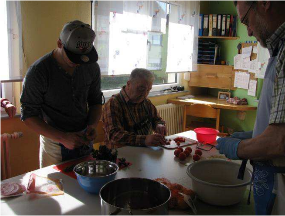
Frühstücksvorbereitung in der Tagesgruppe