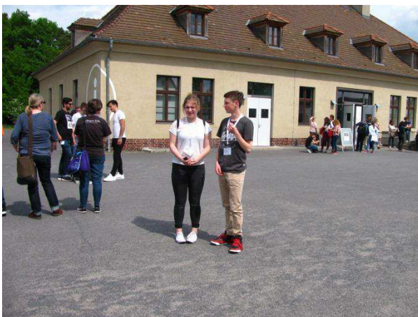
Workshop im Konzentrationslager Sachsenhausen