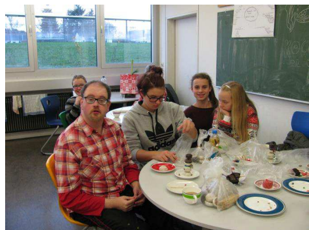
Auch Schneemänneraus Lebkuchen, die zusammengesteckt und verziert werden, dürfen nicht fehlen.