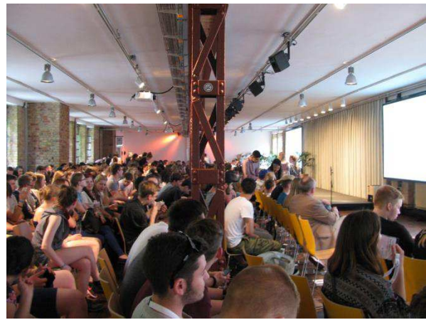
Eröffnung des Jugendkongresses