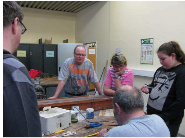
An der Tiffany schmuckstation weiß Herr Alles genau, was zu tun ist.