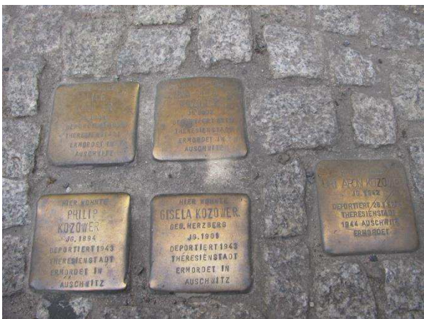
Stolpersteine erinnern an Holocaust