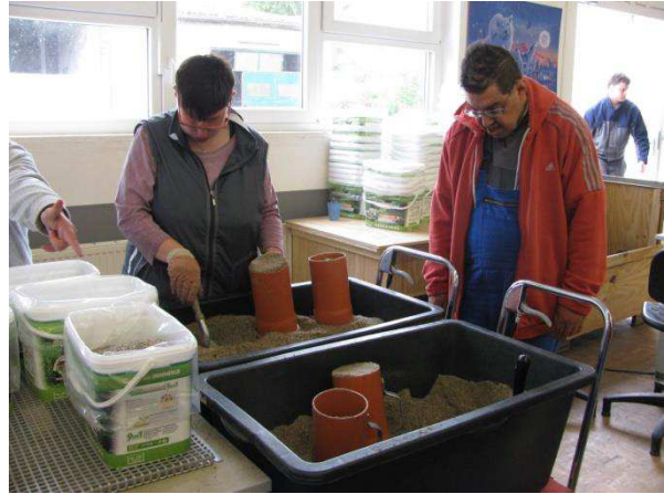
Marktaufbereitung: Verpackung von Aquarienkies