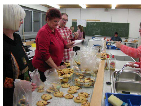
Am Ende müssen die Kunstwerke nur noch gerecht aufgeteilt und verpackt werden.