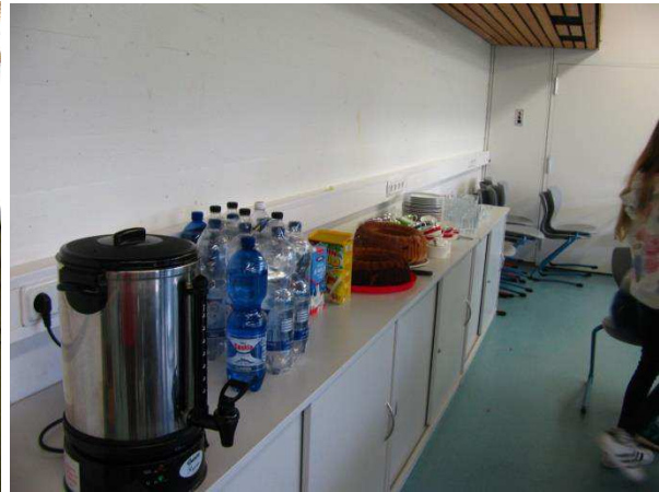
Pause zwischendurch mit anregenden Gesprächen