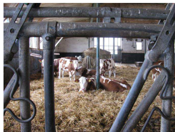
Landwirtschaftlicher Bereich: Rinderhaltung