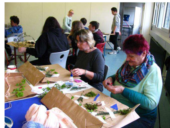
Wenn das Gesicht ausgeschnitten ist, werden die Tüten mit „Waldmaterial“ beklebt.