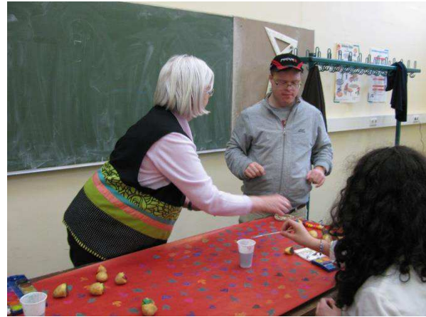
Mit Kartoffelstempeln entsteht aus Packpapier Weihnachtspapier.