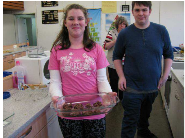
Schokocrossies müssen in die Kühlung