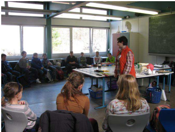
Frau Klein erklärt Hilfsmittel für Blinde