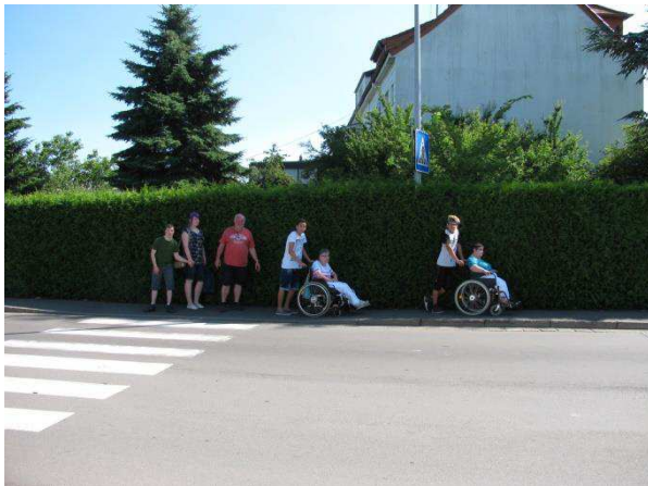
Mit Rollstühlen unterwegs