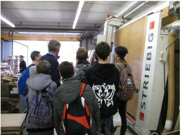
In der Schlosserei