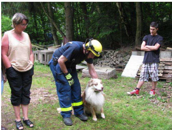
Der Hund erhält seinen Suchbefehl.