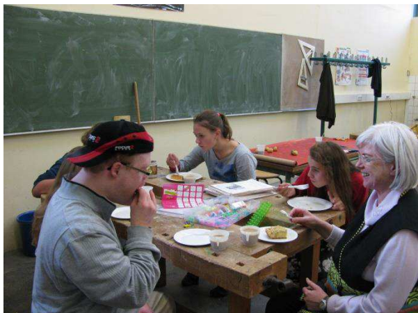
Wer viel arbeitet, hat auch mal eine Pause verdient.