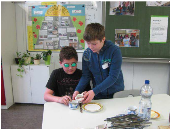
Blind Tee eingießen