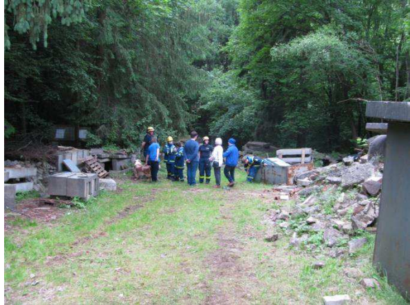
Eine Person versteckt sich in den Trümmern.