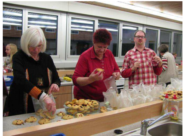
Irgendwie hat jeder stets und ständig etwas zu tun.