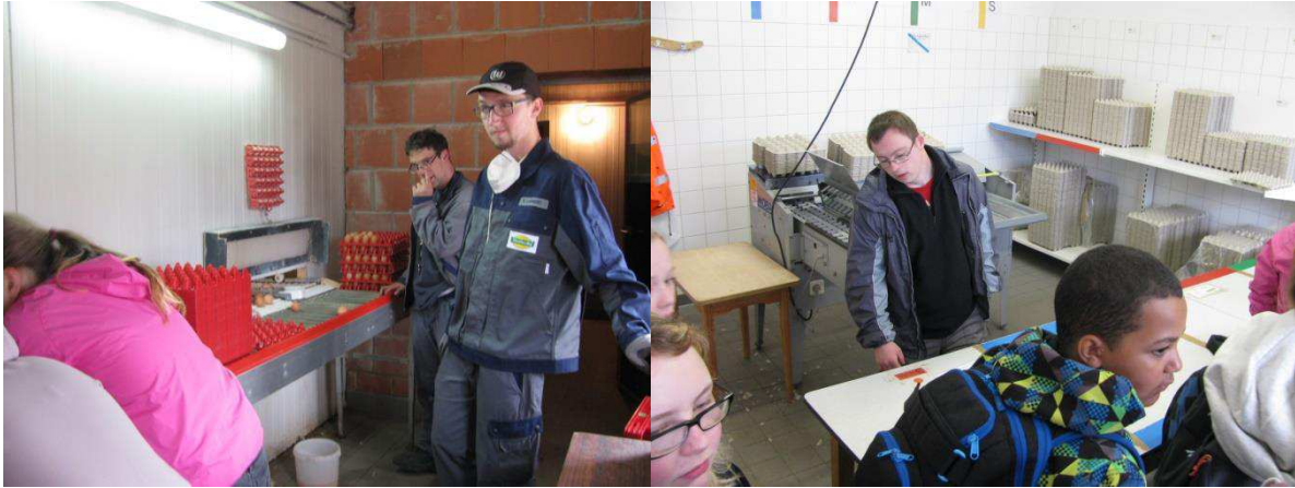
Auf Steigen kommen die Eier in die Marktaufbereitung, wo sie sortiert und gestempelt werden.