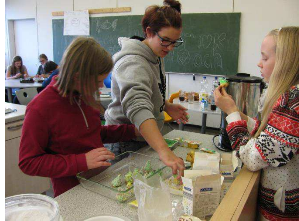
Tannenbäume werden gebacken und mit grünem Zuckerguss und Perlen überzogen.