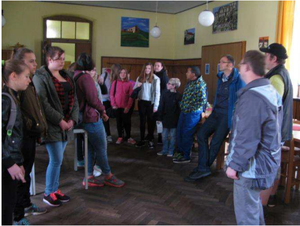
Beginn der Führung