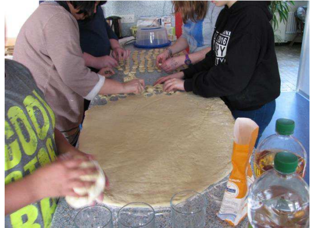
Etwa 300 „Fasekiechelcher“ wurden nach ca. zwei Stunden Arbeit fertig.