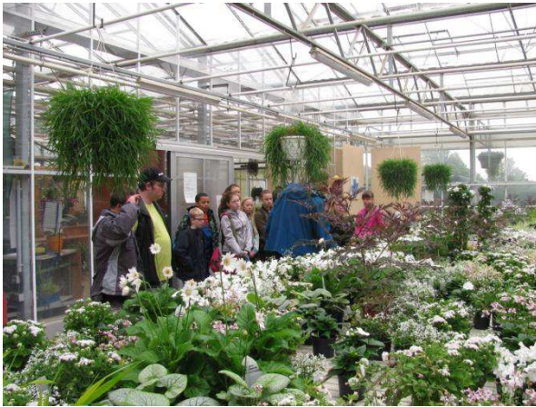
In den Gewächshäusern