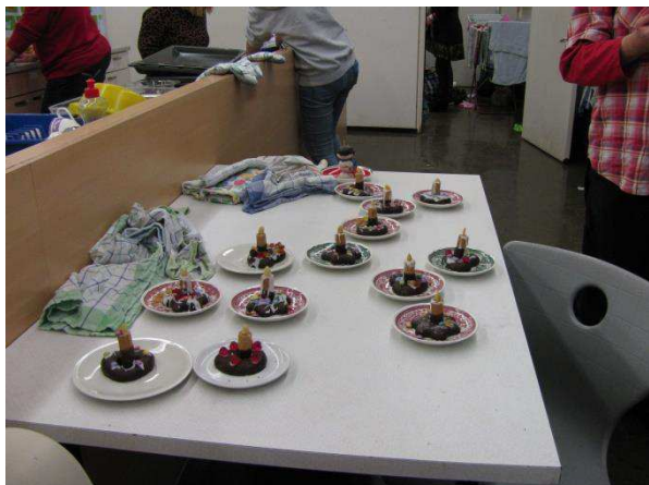
Die Adventskerzen aus Lebkuchen und Zuckerguss