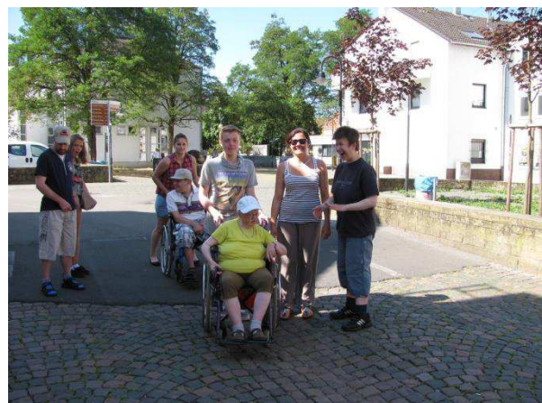
Auf Vieles ist zu achten