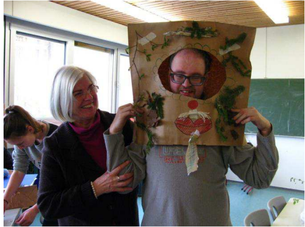
Die besten Ergebnisse – Wer wohl dahinter steckt???