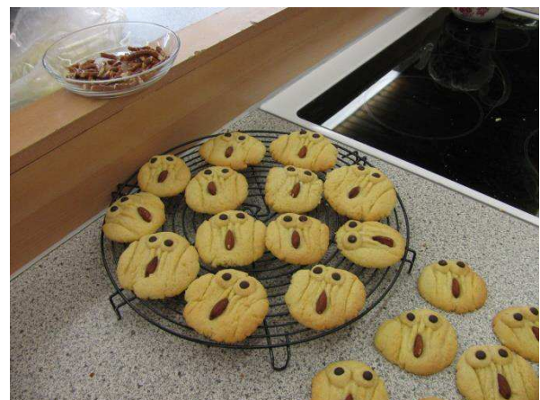
Eulen sind in diesem Jahr besonders gefragt.