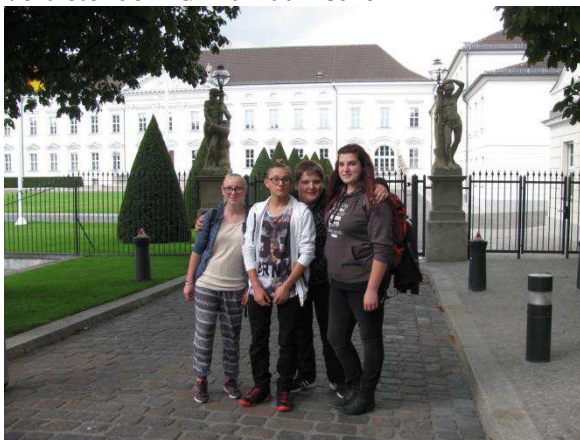
Viele engagierte Jugendliche in Berlin