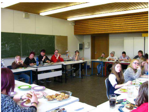
Das gemütliche Beisammensein nach getaner Arbeit bei köstlichem Essen.