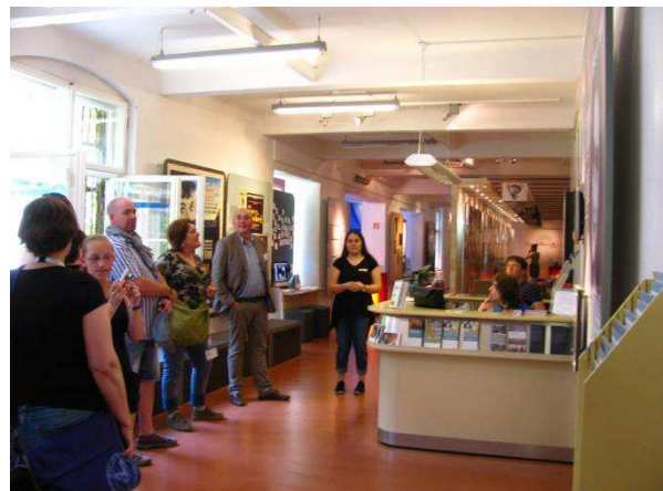
Workshop zu Anne Frank