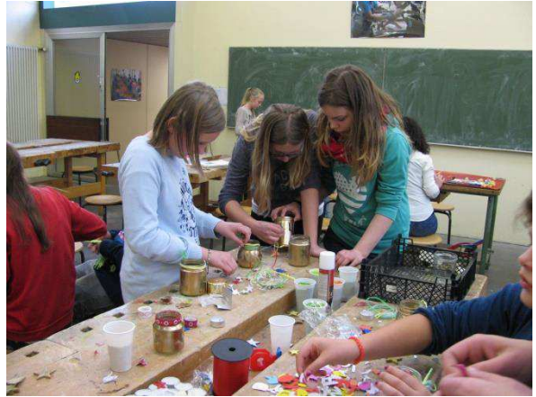
Hier werden Weihnachtswindlichter hergestellt.