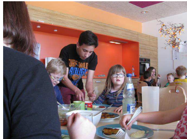
Im integrativen Kindergarten