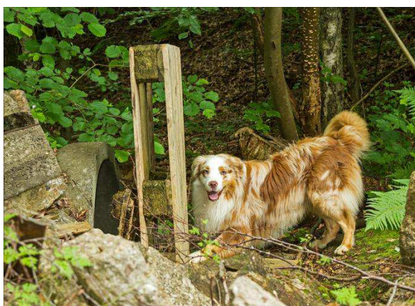
Nach Auffinden der Person schlägt der Hund an.

Nach etwa zweistündigem Programm ließen wir den letzten AG-Tag dieses Schuljahres in gemütlicher Grillrunde ausklingen. Ein besonderer Dank gilt dabei den vielen ehrenamtlichen Helfern des THW sowie der Jugendgruppe des THW, die uns diesen lehrreichen und erlebnisreichen Tag beschert haben.