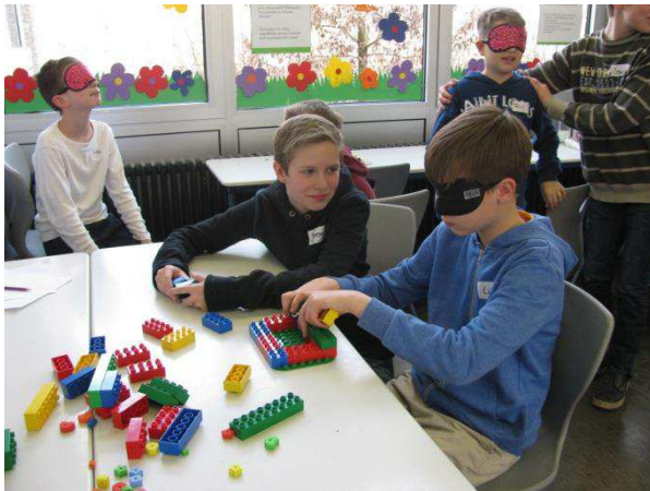
Ein Duplohaus bauen