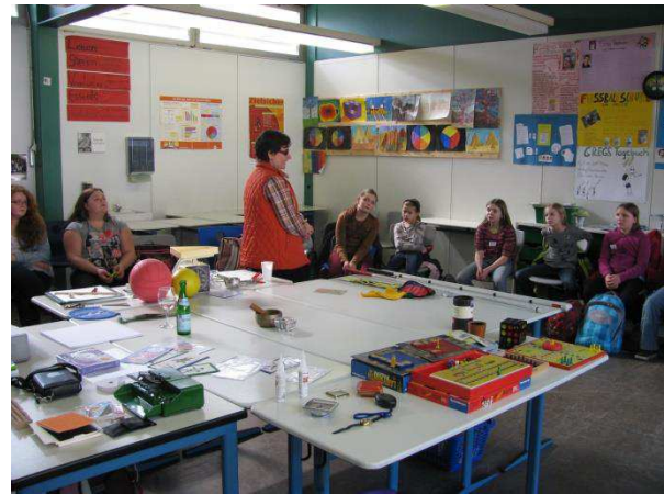
Selbst ein „Blinden-Mensch-ärgere dich nicht“ gibt es