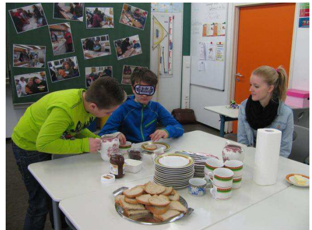
Blind ein Nutellabrot schmieren