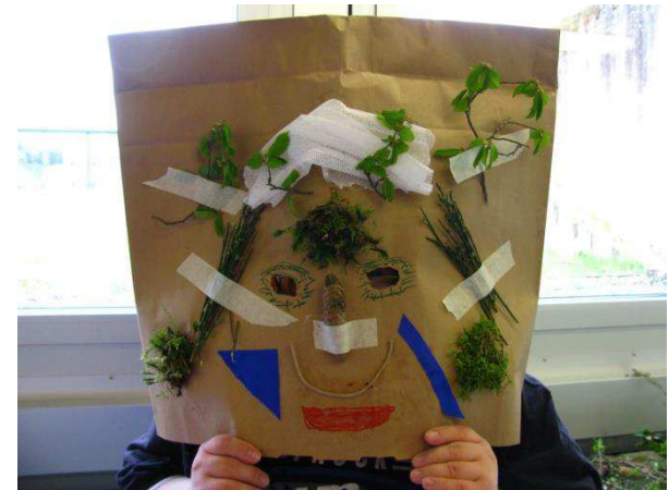
Von „Holla, die Waldfee“ bis zum bössartigen Gnom ist alles dabei.