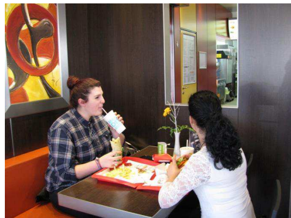
Zwischenstopp im Mc Donalds verknüpft das Angenehme mit dem Notwendigen.