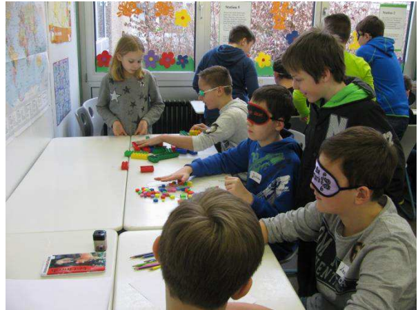
Den Tastsinn testen