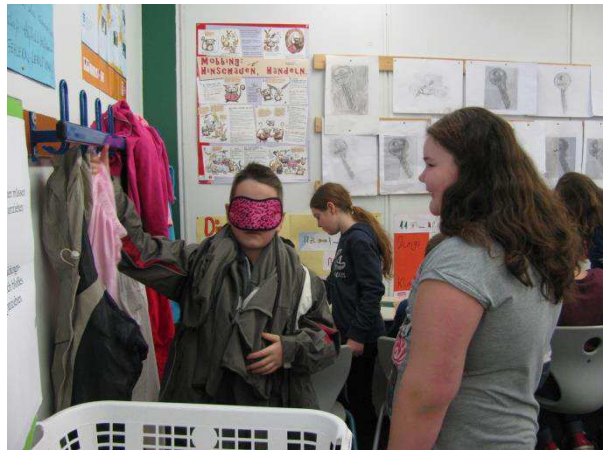
Sich blind anziehen ist besonders schwer.