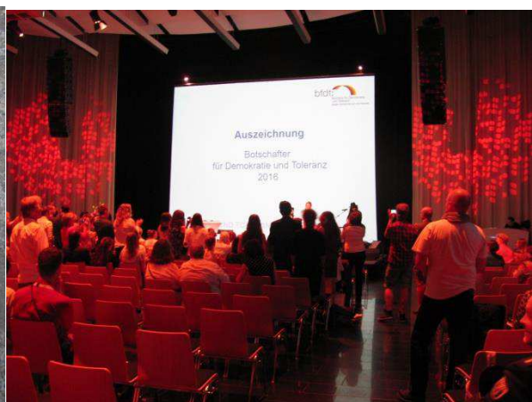
Auszeichnung der Botschafter für Demokratie und Toleranz am Tag des Grundgesetzes