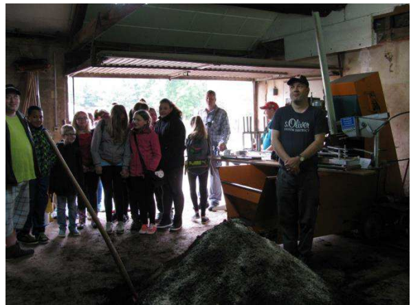
Hier wird Blumenerde für die Gärtnerei gemischt.